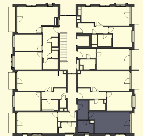
Pohled na dům / Building View